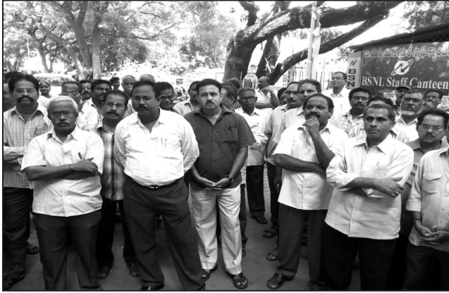
Vijaywada SSA (A.P.)