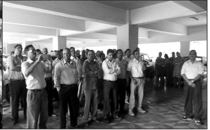
CGMT (MH) Circle